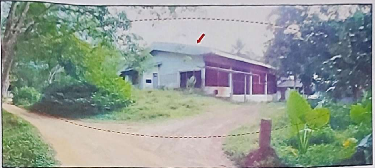
ทรัพย์สินที่ประเมินมูลค่าที่ดินโฉนดเลขที่ 82952 และ 82957 (ติดกัน) พร้อมอาคารโรงรมยางพาราชั้นเดียว และอาคารห้องเก็บของชั้นเดียว จำนวน 2 หลัง เลขที่ 35 หมู่ที่ 8