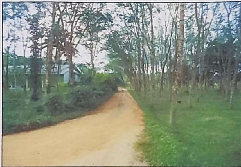
ซอย ศ.ก.ย.บ้านร่มเมือง เป็นถนนผ่านทางหน้าทรัพย์สินที่ประเมินมูลค่า

SIMON LIM & PARTNERS CO., LTD. Real Estate and Machinery Valuers