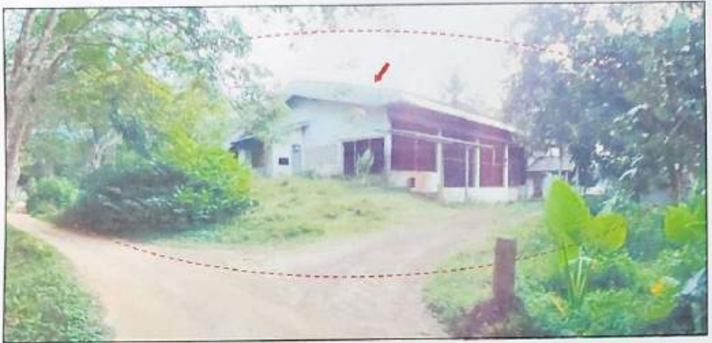
ทรัพย์สินที่ประเมินมูลค่าที่ดิน โฉนดเลขที่ 82952 และ 82957 (ติดกัน) พร้อมอาคารโรงรมยางพาราชั้นเดียว และอาคารห้องเก็บของชั้นเดียว จำนวน 2 หลัง เลขที่ 35 หมู่ที่ 8