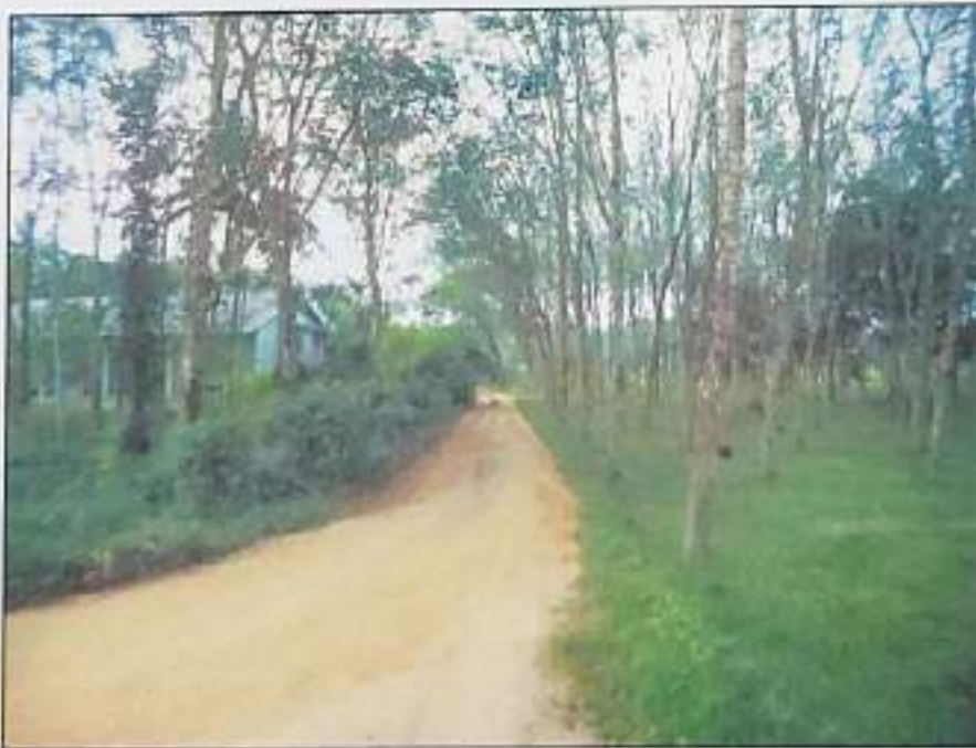
ซอย ส.ถ.ย.บ้านร่วมเมือง เป็นถนนด้านหน้าทรัพย์สินที่ประเมินมูลค่า