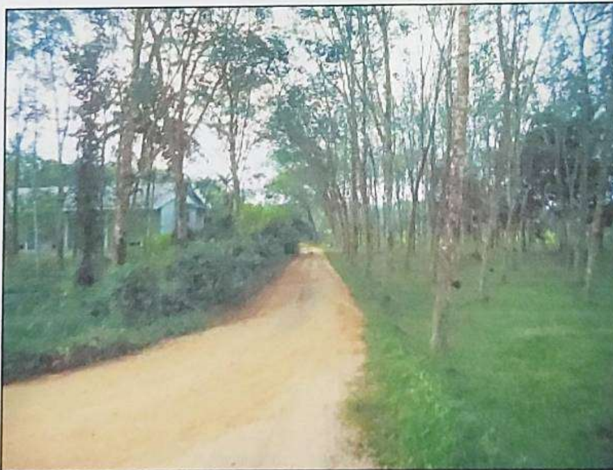
ซอย ส.ก.ย.บ้านร่มเมือง เป็นถนนผ่านทางทรัพย์สินที่ประเมินมูลค่า

SIMON LIM & PARTNERS CO., LTD. Real Estate and Machinery Valuers