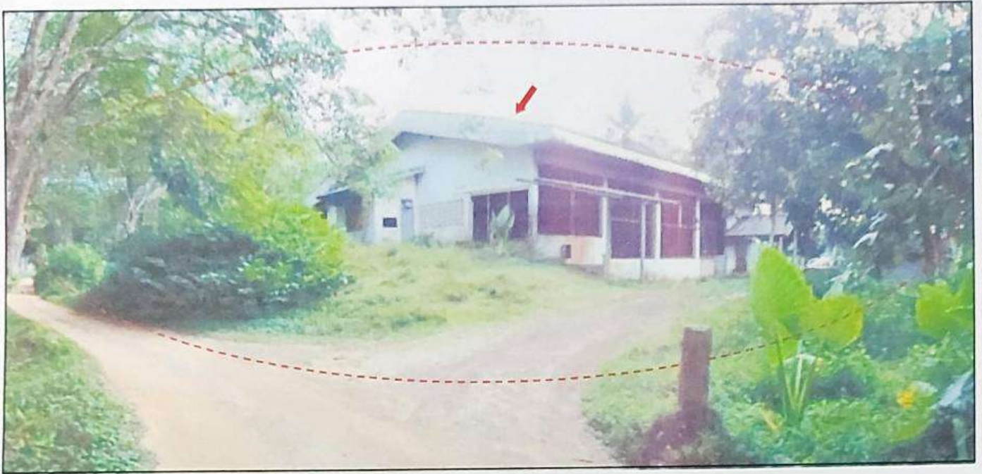
ทรัพย์สินที่ประเมินมูลค่าที่ดิน โฉนดเลขที่ 82952 และ 82957 (ติดกัน) พร้อมอาคารโรงรมยางพาราชั้นเดียว และอาคารห้องเก็บของชั้นเดียว จำนวน 2 หลัง เลขที่ 35 หมู่ที่ 8