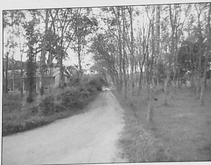
ซอย ศ.ก.ย.บ้านร่วมเมือง เป็นถนนผ่านทางทรัพย์สินที่ประเมินมูลค่า

SIMON LIM & PARTNERS CO., LTD. Real Estate and Machinery Valuers