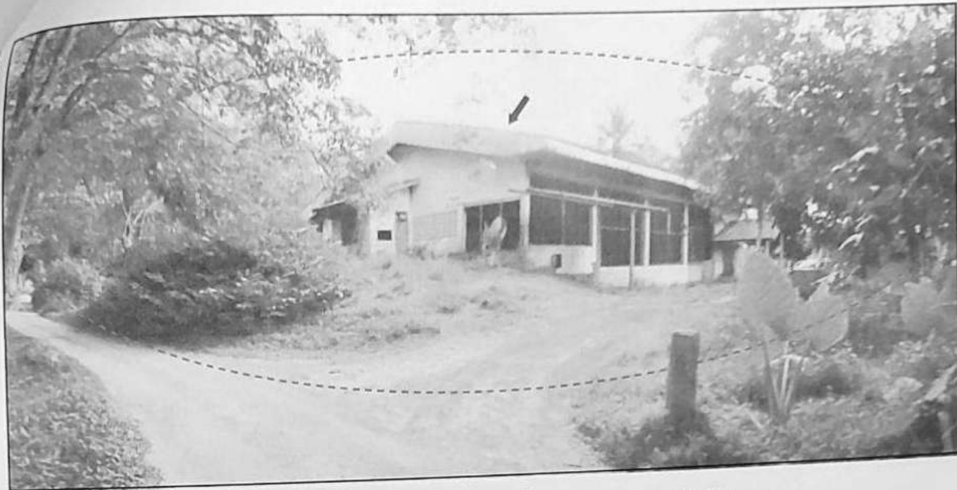
ทรัพย์สินที่ประเมินมูลค่าที่ดิน โฉนดเลขที่ 82952 และ 82957 (ติดกัน) พร้อมอาคาร โรงรมยางพาราชั้นเดียว และอาคารห้องเก็บของชั้นเดียว จำนวน 2 หลัง เลขที่ 35 หมู่ที่ 8