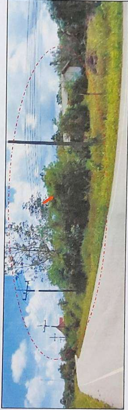
ทรัพย์สินที่ประเมินมูลค่าที่ดินโฉนดเลขที่ 7488 พร้อมอาคาร โด่งชั้นเดียว กลุ่มเกษตรกรทำทุ้งนารี จำนวน 1 หลัง เลขที่ 47 หมู่ที่ 3

SIMON LIM & PARTNERS CO., LTD. Real Estate and Machinery Valuers