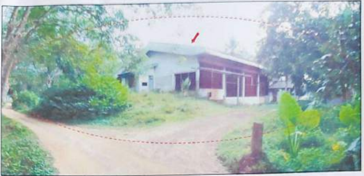
ทรัพย์สินที่ประเมินมูลค่าที่ดินโฉนดเลขที่ 82952 และ 82957 (ติดกัน) พร้อมอาคารโรงรมยางพาราชั้นเดียว และอาคารห้องเก็บของชั้นเดียว จำนวน 2 หลัง เลขที่ 35 หมู่ที่ 8