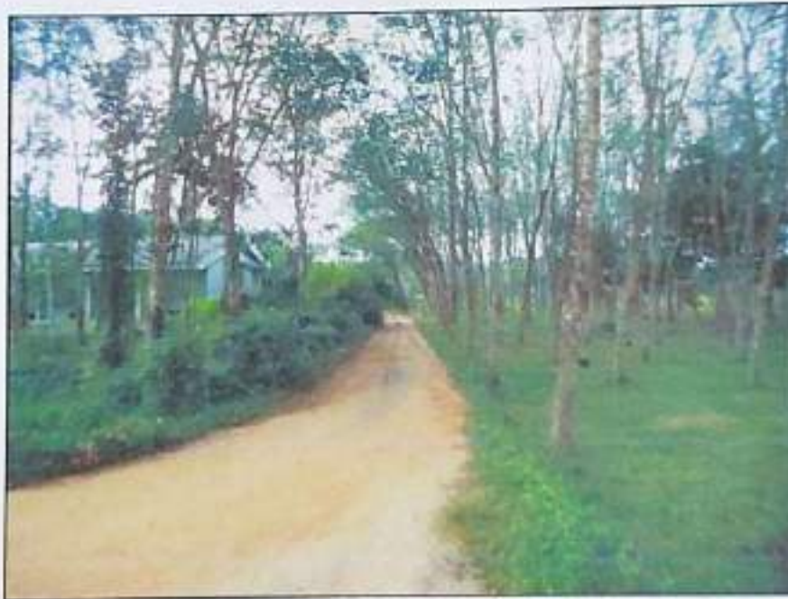
ขอ ส.ก.ย.บ้านร่มเมือง เป็นถนนผ่านหน้าทรัพย์สินที่ประเมินมูลค่า