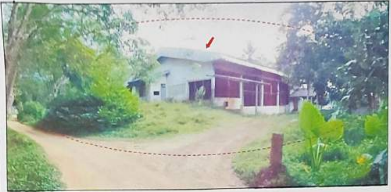
ทรัพย์สินที่ประเมินมูลค่าที่ดิน โฉนดเลขที่ 82952 และ 82957 (ติดกัน) พร้อมอาคาร โรงรมยางพาราชั้นเดียว และอาคารห้องเก็บของชั้นเดียว จำนวน 2 หลัง เลขที่ 35 หมู่ที่ 8