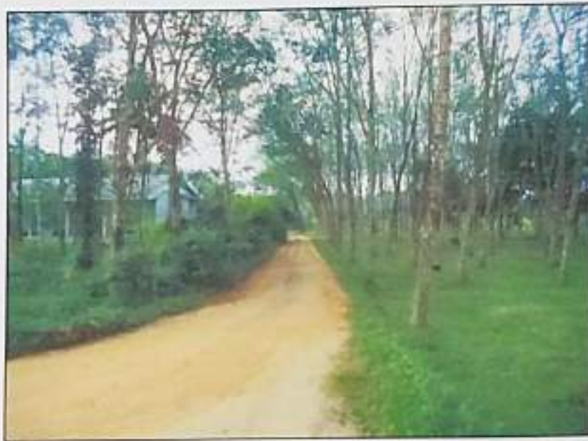
ซอย ศ.ก.ย.บ้านร่วมเมือง เป็นถนนผ่านหน้าทรัพย์สินที่ประเมินมูลค่า