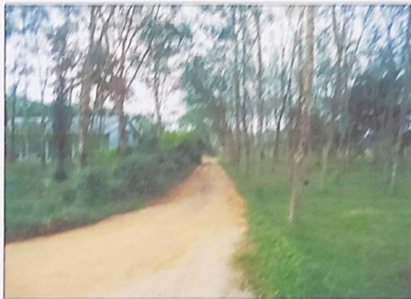
ซอย ส.ล.ม.บ้านร่วมเมือง เป็นถนนด้านหน้าทรัพย์สินที่ประเมินมูลค่า