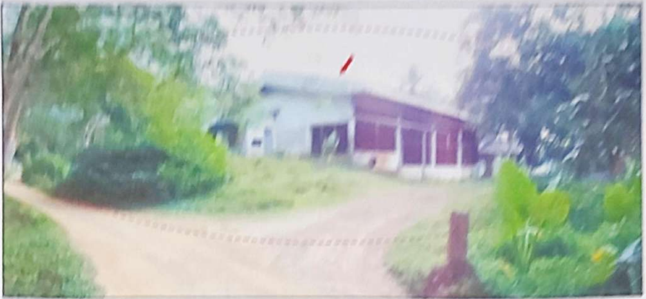
ทรัพย์สินที่ประเมินมูลค่า ที่ดินโฉนดเลขที่ ๕๖๕๖ และ ๕๖๕๗ (คิดรวม) พร้อมอาคารโรงงานการทอผ้าเส้นใย และอาคารสีกรองใยของเส้นใย จำนวน 2 หลัง เนื้อที่ 35 ไร่ที่ ๕