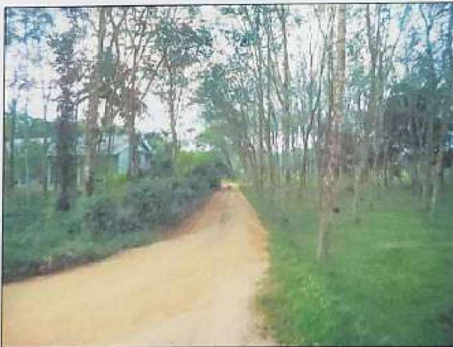
ซอย ส.ถ.ม.บ้านร่วมเมือง เป็นถนนค่านหน้าทรัพย์สินที่ประเมินมูลค่า