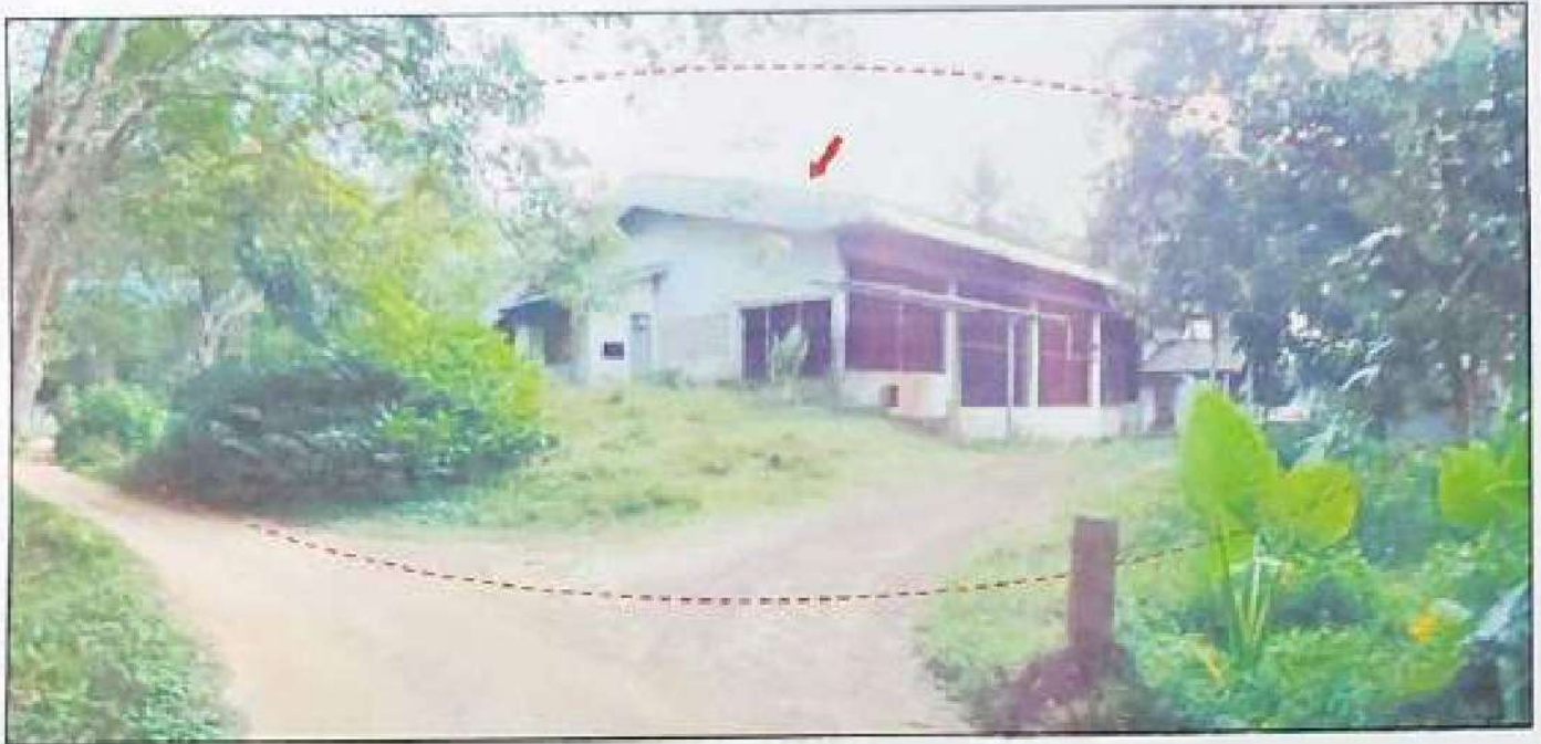
ทรัพย์สินที่ประเมินมูลค่าที่ดิน โฉนดเลขที่ 82952 และ 82957 (ติดกัน) พร้อมอาคารโรงรมขนพาราชั้นเดียว และอาคารห้องเก็บของชั้นเดียว จำนวน 2 หลัง เลขที่ 35 หมู่ที่ 8